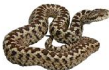
Vipera dell'Orsini ( Vipera ursinii )