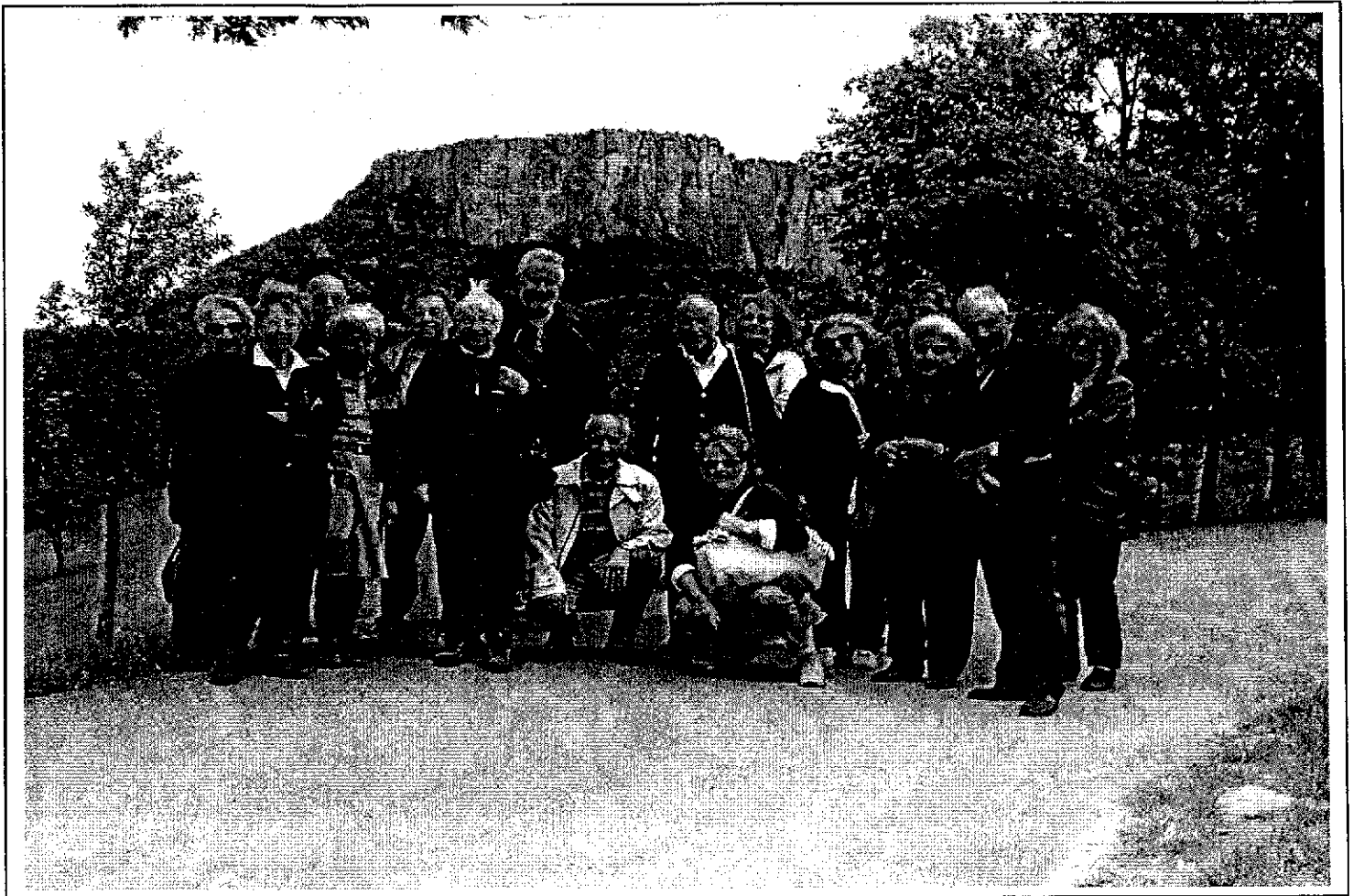
Il gruppo degli escursionisti sullo sfondo della Pietra di Bismantova