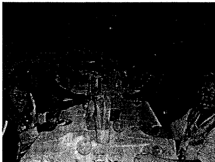
Un momento conviviale durante la gita a Marradi il 10 ottobre 2004, in occasione della Sagra delle castagne

I programmi dettagliati delle manifestazioni saranno disponibili tempestivamente presso l'Erboristeria Montanari in Via Marsala.