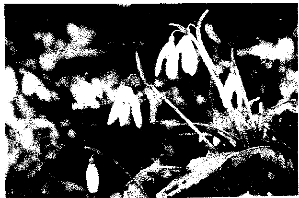
Il grazioso bucaneeve.

Al caro generale Landi, sempre così entusiasticamente vicino alla nostra Unione giungano le condoglianze più sentite ed affettuose dell'intero corpo sociale.