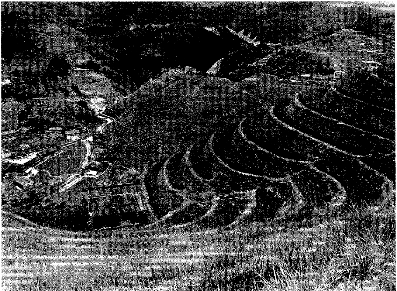
Terrazzamenti a risaia presso Longsheng (Guanxi, Repubblica Popolare Cinese).

Per facilitare le comunicazioni e la diffusione delle notizie, il Consiglio Direttivo invita i soci a comunicare il proprio indirizzo di posta elettronica alla nuova mail dell'UBN: naturalisti@iperhole.bologna.it