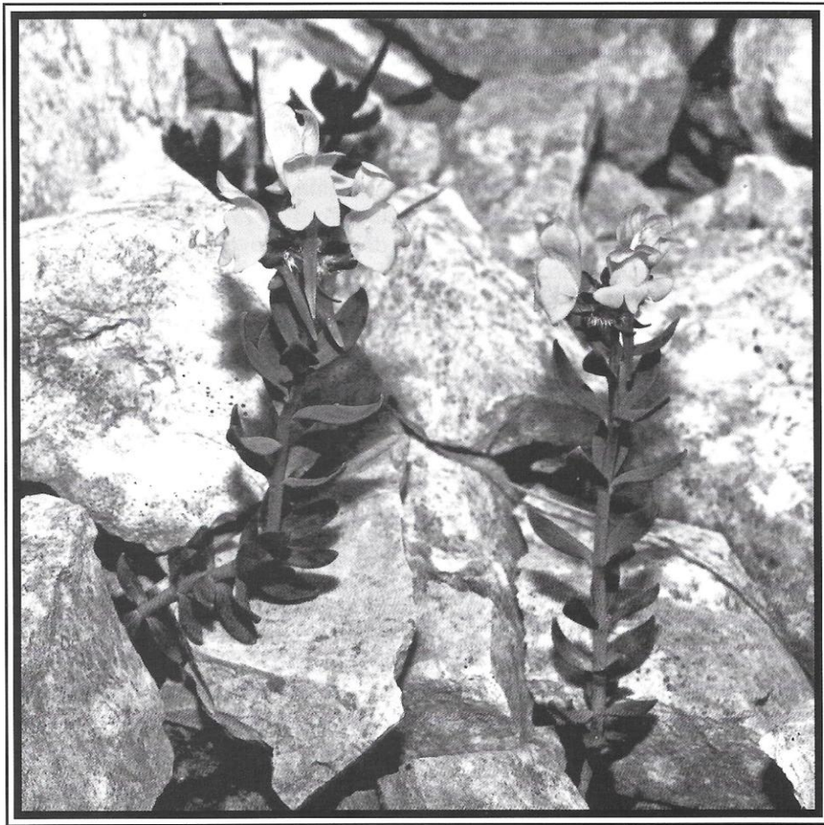
Linaria tonzigii , raro endemismo delle Prealpi Lombarde.