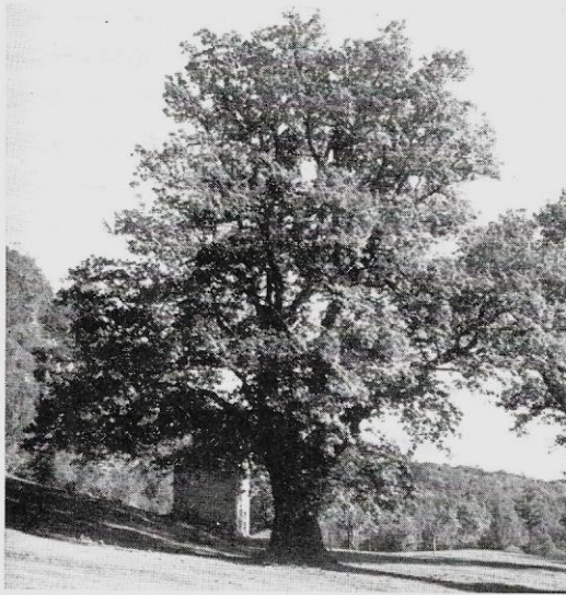
Fig. 1. - Quercia plurisecolare di Gottro (val Menaggio, prov. di Como) - monumento nazionale.

Nella Val Menaggio (Como) vicino al paese di Gottro, si trova una quercia il cui tronco misura oltre 10 metri di circonferenza a 1,50 dal piede. L'albero, malgrado l'età, che alcuni esperti ritengono di almeno 8 secoli, è perfetto in ogni sua parte, con ramificazioni intatte e bene equilibrate. Si trova in un breve pianoro esposto a mezzogiorno, riparato dal vento del Nord dalla montagna, che sorge a tergo, alquan-