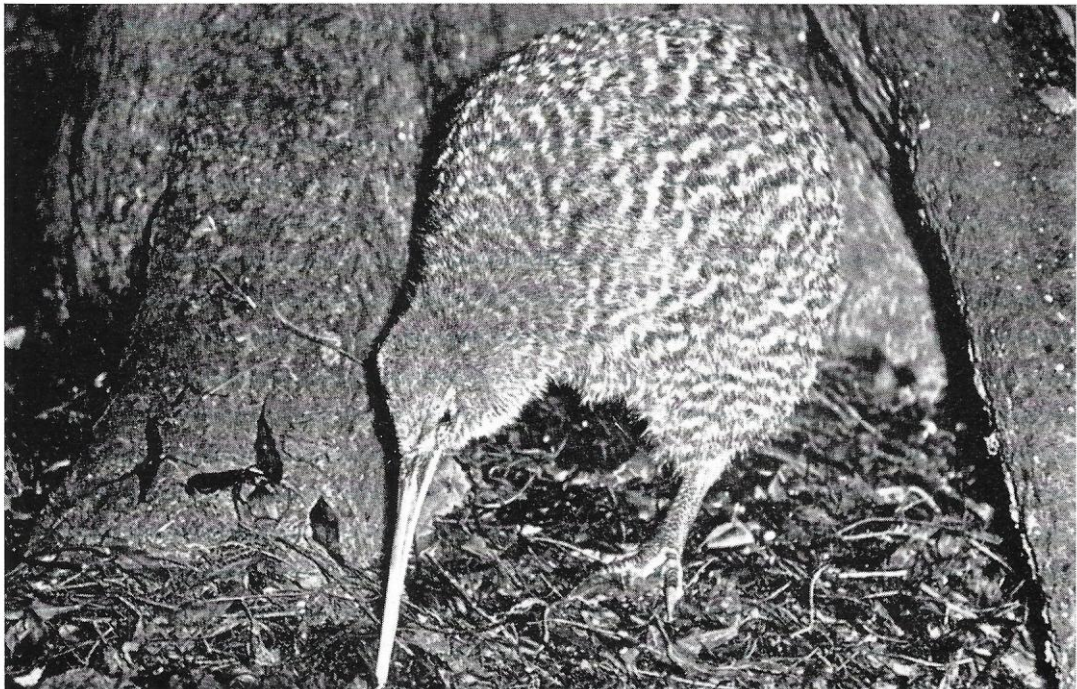
Apteryx oweni .