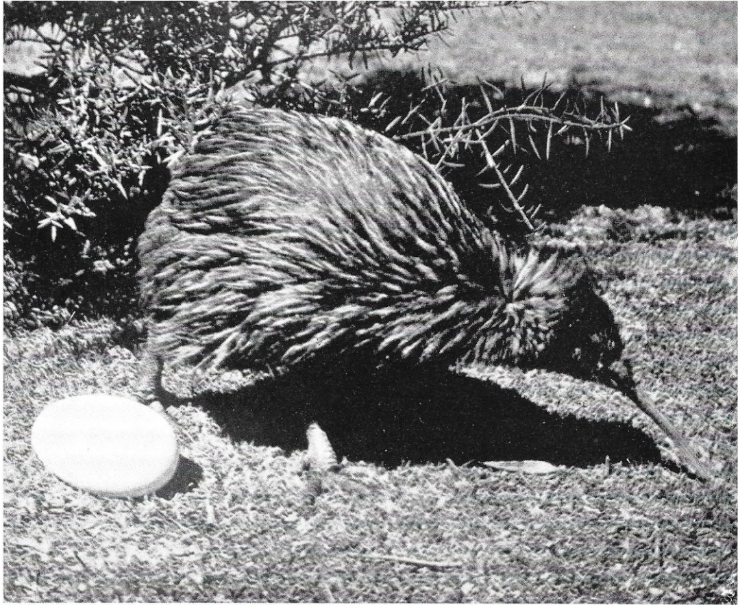
Apteryx mantelli .