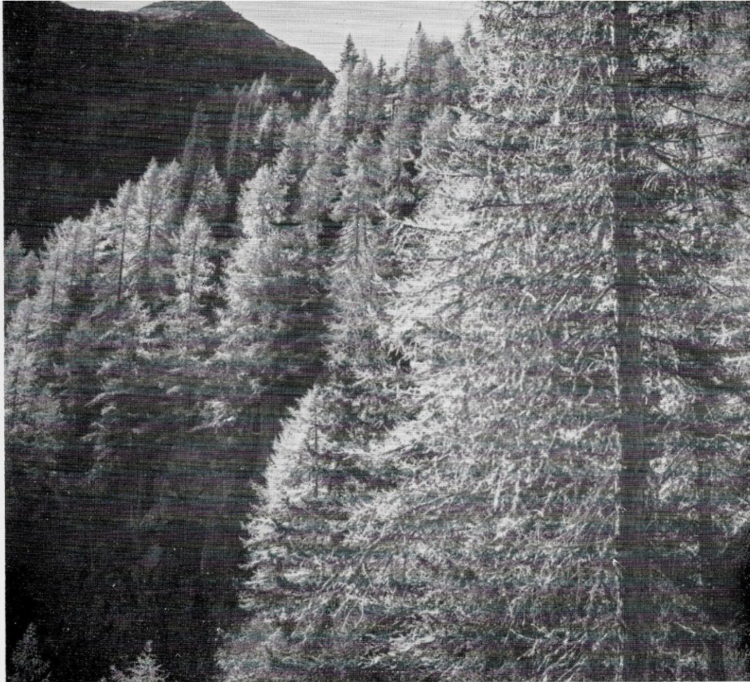
Fig. 4. - Lariceto in Val del Lares.

ciali, danno origine ad un complesso di vita paludicola, oltremodo interessante in questo periodo in cui, pur contrastata da noi naturalisti, si fa sempre più strada la moda di bonificare ed eliminare le paludi. Io ebbi la ventura nel 1926 di navigare nel piccolo lago di Nanos nel centro dell'isola di Rodi, lago formato naturalmente da una frana che, caduta nel mezzo di un torrentello, aveva formato a monte il lago nel quale, insieme coll'amico Brian, trovammo plancton che si stava sviluppando, nonché molti esemplari di granchi d'acqua dolce.