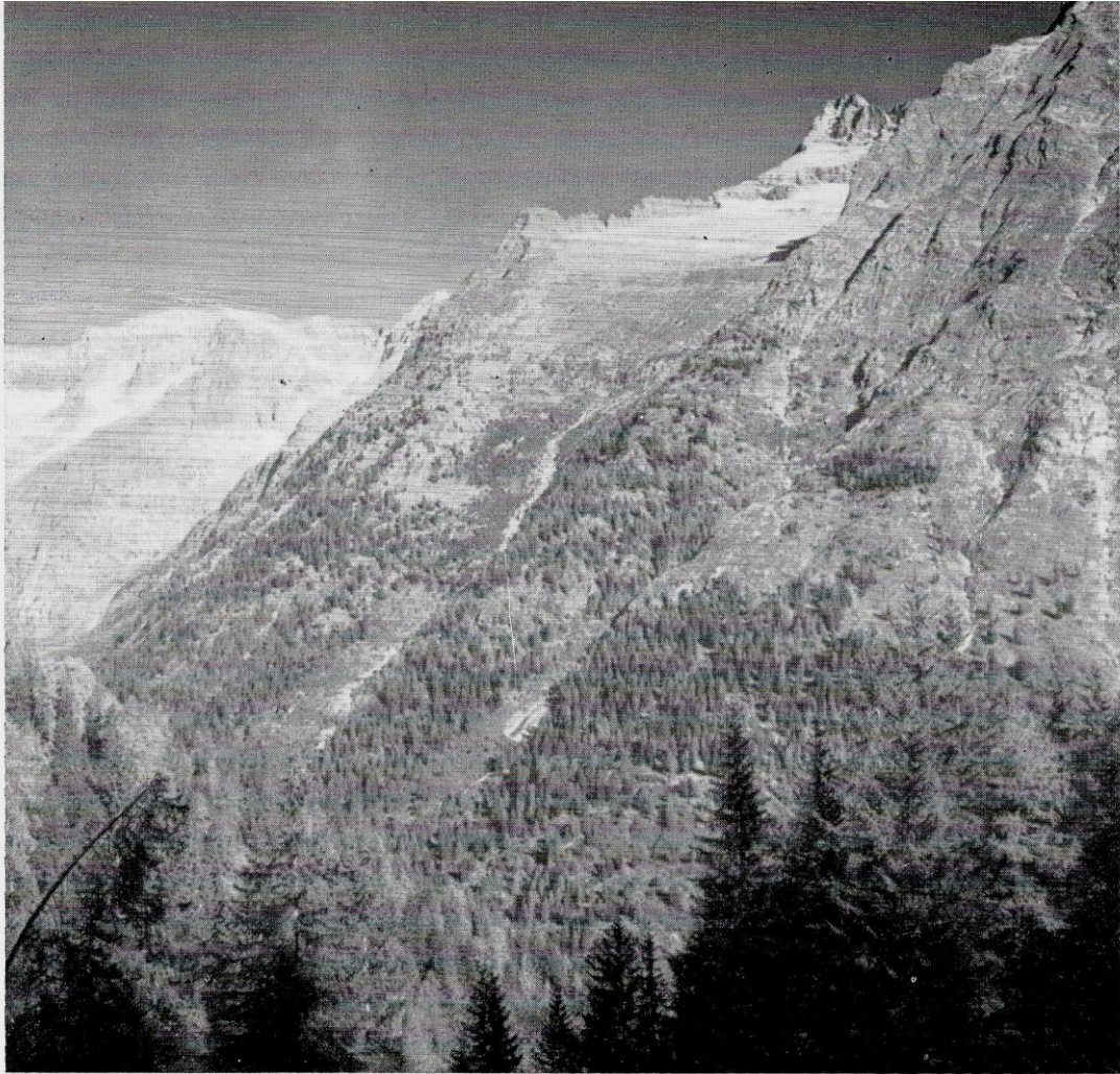
Fig. 5. - Boschi di protezione Le Bene in Val di Genova; nel fondo la Busazza (m. 3210).

ve attentato alla integrità della Natura in montagna, sono le gallerie di gronda che oggi gli idroelettrici costruiscono continuamente per impadronirsi fino all'ultima stilla d'acqua che scorre nei ruscelli montani. Mi richiamo a questo proposito a quanto ha scritto il compianto Collega Ciro Andreatta e a quanto, da decenni, scrive e sostiene Michele Gortani . Per parte mia farò alcune considerazioni prevalentemente geografiche-ecologiche.