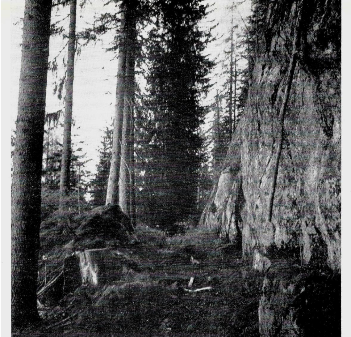
Fig. 7. - Taglio a dirado in Val di Genova.

L'acqua che scorre nei monti sotto forma di fiumi, di torrenti o di ruscelli, zampilla e, zampillando, dà origine alla formazione di goccioline d'acqua che si portano nell'atmosfera e vi creano vapor d'acqua, il quale si condensa sotto forma di rugiada che contribuisce a mantenere la freschezza del pascolo. Anche qui mi sia consentita una osservazione che tutti coloro che hanno visitato grandi fiumi equatoriali hanno potuto compiere. Vi è sul lato sinistro della cascata dello Zambesi una corrente d'acqua che cade e si frange, a notevole altezza, sopra massi colossali; rimbalzando l'acqua si trasforma in pioggia e questa determina la formazione di una foresta di tipo equatoriale, detta la foresta della pioggia, nella zona fronteggiante quella parte della