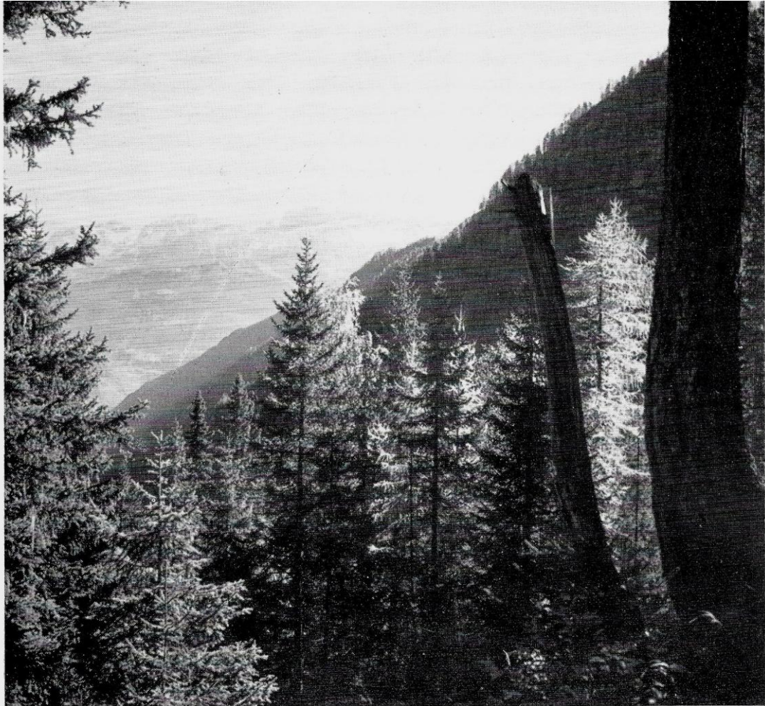
Fig. 6. - I boschi di Val del Lares. Nel fondo il gruppo di Brenta.

no, completamente roccioso, impediva l'assorbimento dell'acqua di infiltrazione.