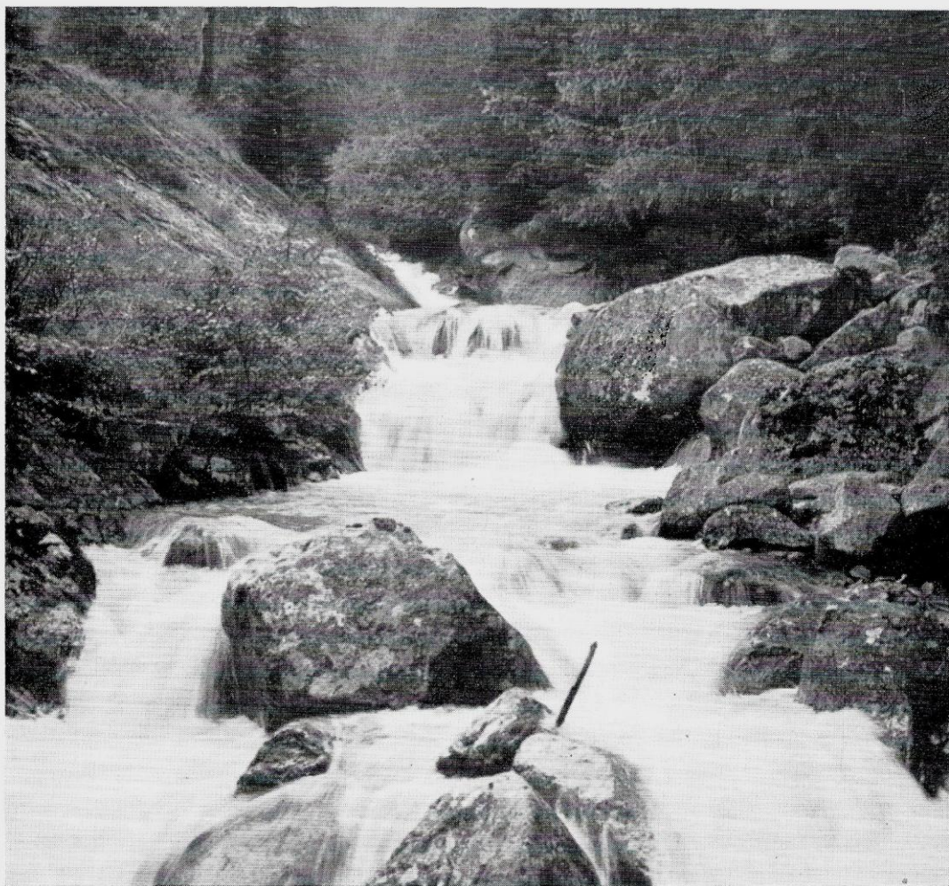
Fig. 3. - Rio Nardis, presso la Malga.

pochissimo intaccate dall'acqua. Se vogliamo dare i massimi esempi, ricordiamo le cascate del Niagara e quelle dello Zambesi. Le prime creano a monte un grande lago, non navigabile perché pieno di massi che determinano la formazione di violente rapide, ma a monte della cateratta dello Zambesi esiste un vero e proprio lago navigabile dove io ho anche veduto affiorare le teste di due ippopotami e dove esistono isolette coperte di ricca vegetazione arborea. La stessa cosa può osservarsi in cascate di minore importanza, come quella di Kegan in Giappone, alta un centinaio di metri, e la bellissima di Nardis già nominata, ed alta altrettanto. I laghi, naturali o artifi-