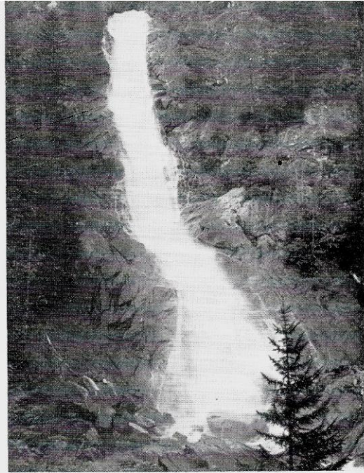
Fig. 2. - Cascata superiore di Nardis.

Orbene, a tutte queste bellezze ha tentato la Società idroelettrica S.I.S.M. la quale aveva avuto, fino dal 1961, l'autorizzazione del Ministero dei Lavori Pubblici a compiere lavori che avrebbero completamente snaturato la valle.