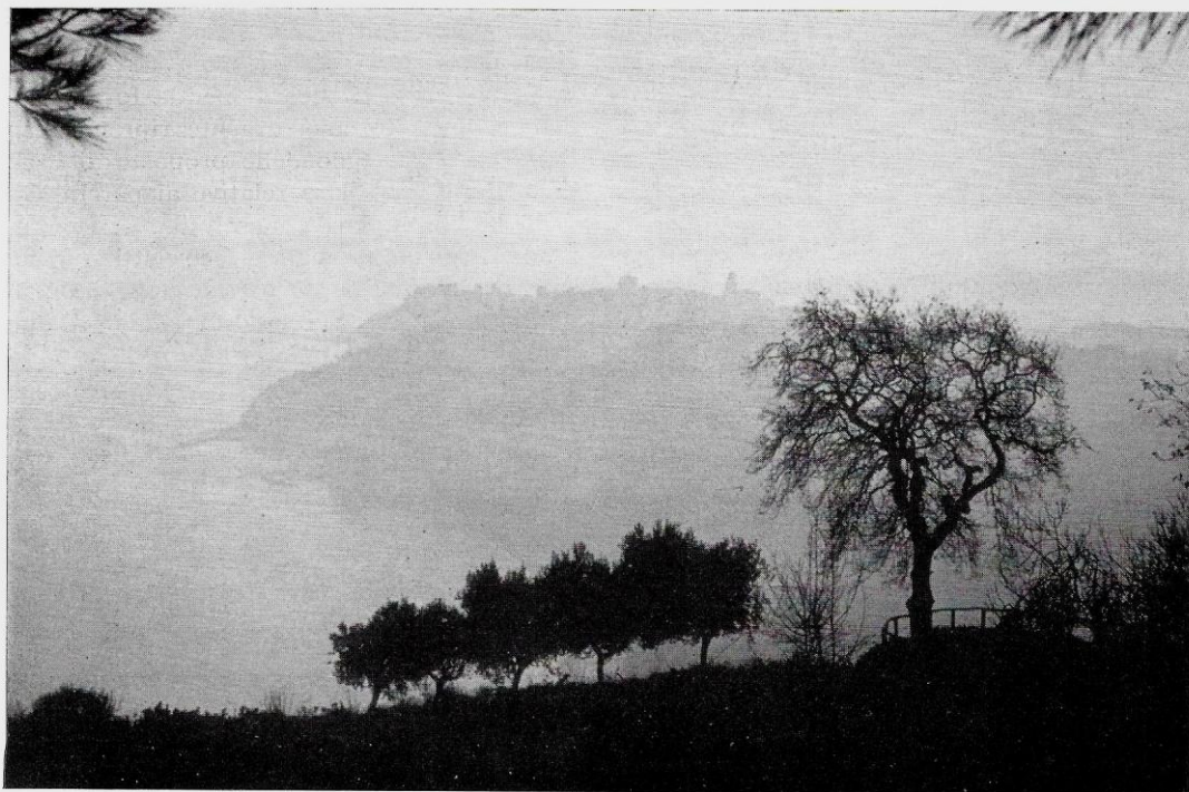
Gli abitati di Sirolo e Numana come si intravedono nella nebbia di un mattino primaverile scendendo lungo il versante Sud del Monte Conero.