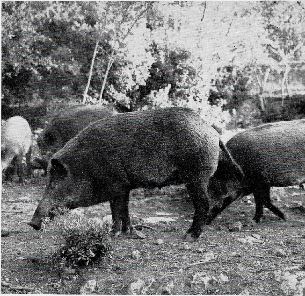
3) Cinghiale al pascolo in una riserva della Maremma.

U.). Le riserve private vengono a subire ulteriori limitazioni, controlli ed oneri e le concessioni delle stesse vengono trasferite alle Amministrazioni Provinciali.