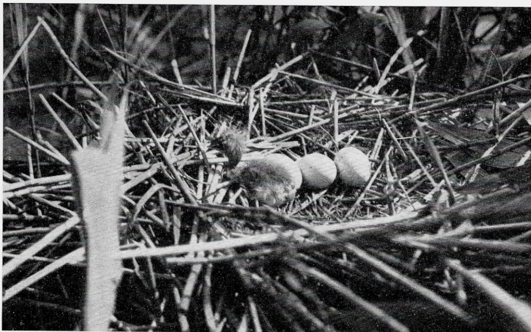
4) Nido di Airone rosso, nella costa del Lamone, Ravenna.

ve produrre anche il certificato medico di idoneità e il certificato di abilitazione all'esercizio venatorio da rilasciarsi dai Comitati Provinciali della Caccia, secondo le disposizioni impartite dal Ministero dell'Agricoltura e delle Foreste. Questa disposizione, se applicata seriamente, consentirebbe non solo di evitare che persone non idonee esercitino la caccia, ma anche coloro che difettano delle più elementari nozioni biologiche nell'esercizio di uno sport che le richiede. Si arriverebbe in altri termini alla istruzione del cacciatore, per quanto in forma più ridotta di quanto avviene in altri paesi venatoriamente evoluti, come la Germania.