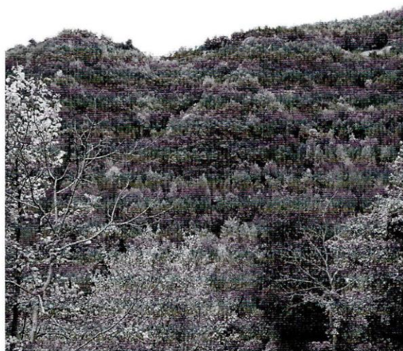
Il bosco di Valzo.