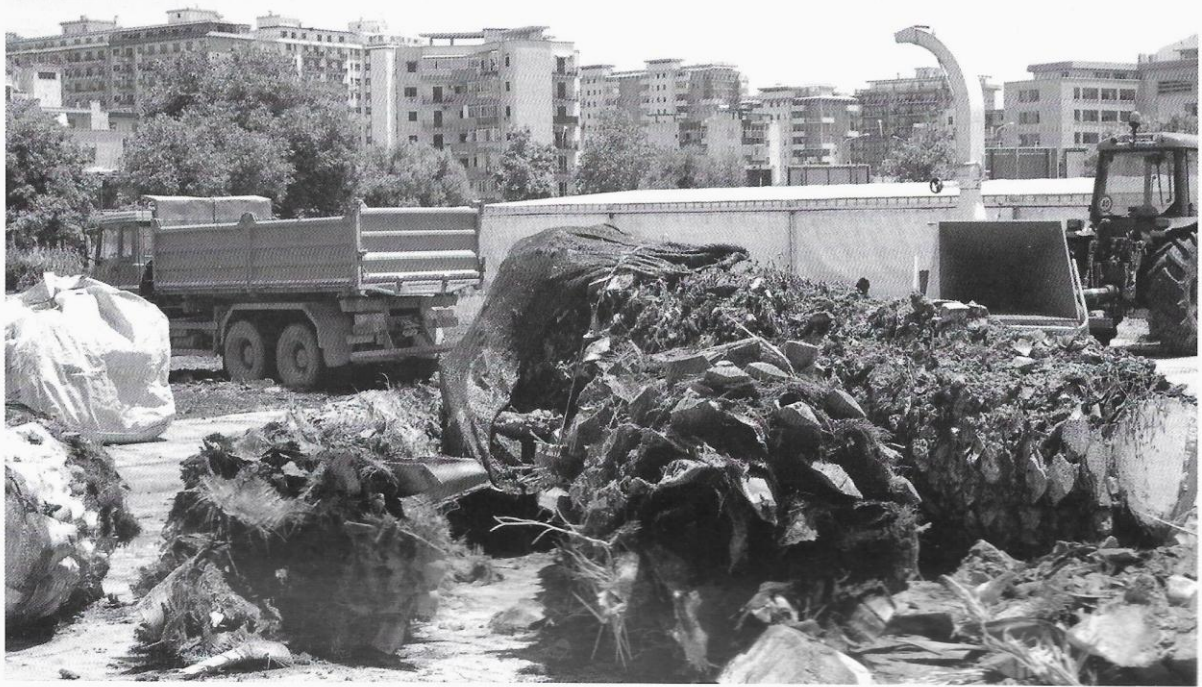
Resti di palme attaccate che saranno avviate alla triturazione negli appositi centri allestiti dall' Azienda Regionale Foreste Demaniali Regione Siciliana.

e lavori socialmente utili, che buttano giù piante morte arrivando per il funerale delle palme, mentre lo stesso punteruolo perde inesorabilmente nei due campi di battaglia di Villa Tasca d'Almerita e di Villa Malfitano". E invece gli enti tirati in ballo nell'articolo sanno benissimo che non si possono impiegare su vasta scala insetticidi dichiaratamente non idonei per l'impiego in aree urbane. È questo il caso di vari prodotti il cui uso è ammesso soltanto nel settore agricolo (in vivaio o in pieno campo), come il chlorpirifos usato dai due "soci" menzionati dal Corriere.