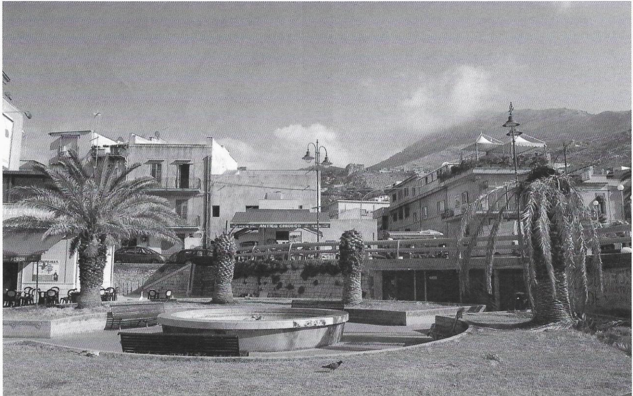
Palme attaccate dal Punteruolo rosso a Sferracavallo (Palermo). Si notano due esemplari ormai morti (al centro), una palma con evidente infestazione in stadio avanzato (a destra) e palma con i primi sintomi di attacco da parte del coleottero (foglie appassite e asimmetria della chioma).

120 giorni, durante i quali le piante sospette devono essere interamente avvolte in una rete a maglia sottile e sottoposte a trattamenti quindicinali con insetticidi. Purtroppo questo rigido protocollo, che prevede tra l'altro l'introduzione di un passaporto che assicuri la tracciabilità delle palme prodotte in vivaio, è entrato in vigore quando ormai il punteruolo rosso aveva già cominciato a scorazzare per la Sicilia, dove si produce il 50% delle palme italiane, con un fatturato annuo stimato nel 2007 pari a 125 milioni di euro, secondo i dati dell'Associazione Vivaisti Esportatori.