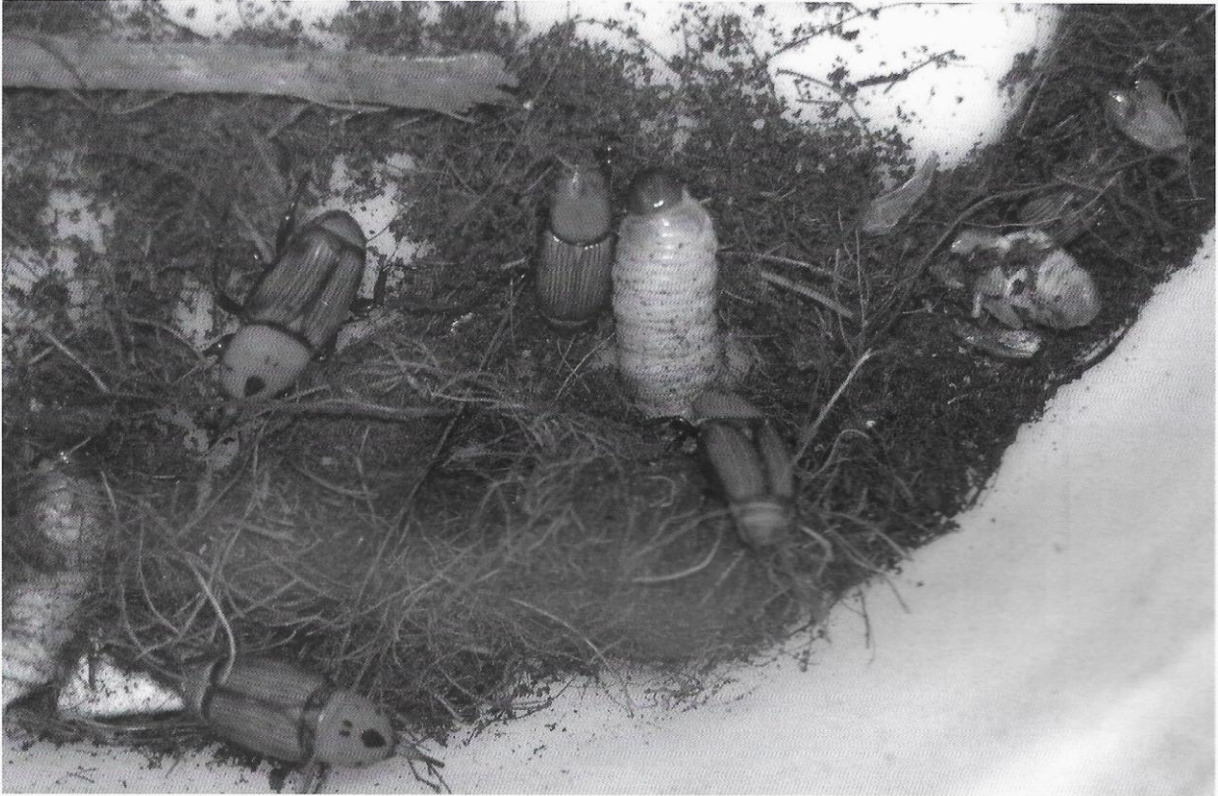
Ultimi stadi larvali, una pupa ed adulti di Rhynchophorus ferrugineus (Olivier) rinvenuti contemporaneamente nella stessa palma infestata.

et al., 1996), e in poco più di un decennio è stato segnalato anche in Francia meridionale, Corsica, Sardegna, Italia, Sicilia, Grecia e Turchia. L'infestazione si è sempre originata da focolai costituiti involontariamente da aziende florovivaistiche che commerciano palme adulte destinate all'arredo urbano. Anche in Medio Oriente questo fitofago è stato introdotto a causa del commercio, particolarmente quando, negli anni '80, cominciarono ad essere diffusamente coltivate in estremo oriente la palma da dattero, la palma da olio africana ( Eleis guineensis Jacq.) e la palma cubana ( Roystonea regia O. F. Cook). Negli stessi anni il curculionide giunse negli Emirati Arabi, e da qui si diffuse in Medio Oriente, rivelandosi estremamente dannoso per i dattileti egiziani e della penisola arabica.