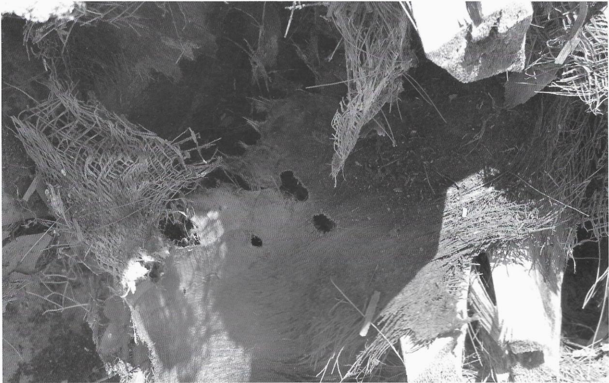
Fori praticati dall'azione del Punteruolo rosso sulle basi fogliari di Phoenix canariensis L.

tonia robusta (Linden ex André) H. Wendl., W. filifera H. Wendl., Howea forsteriana (C. Moore et F. v. Muell.) Becc., Jubaea chilensis (Molina ex Humb., Bompl. et Kunth) Baill., Syagrus romanzoffiana (Mart.) Becc., Sabal palmetto (Walter) Lodd. ex Shult. et Schult. f., Livinstona chinensis (R. Br.) Mart., Phoenix dactylifera ma, come già detto, gli attacchi riguardano principalmente la palma delle canarie, Phoenix canariensis , con un rapporto di circa 500 a 1.