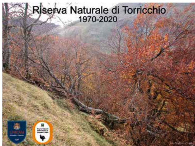
Scorcio della riserva di Torricchio

come si può vedere nella fotografia di Stefano Chelli del 2019, con un faggio schiantato a terra in mezzo alla foresta. Questa fotografia è la prova che la riserva di Torricchio ha raggiunto il suo scopo!