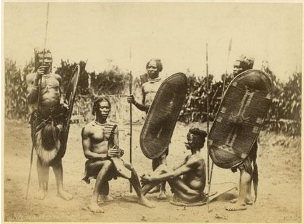
Uomini sandè, 1877