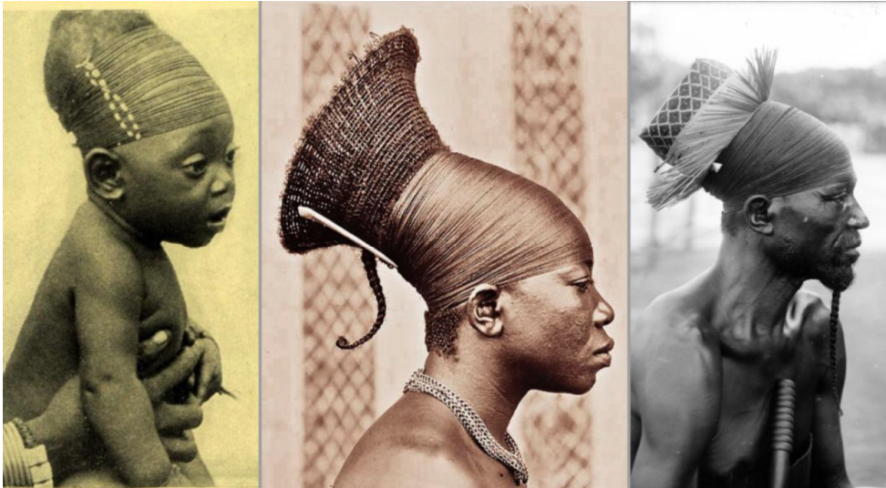
Genti mangbetu, primi anni '20 del XX secolo