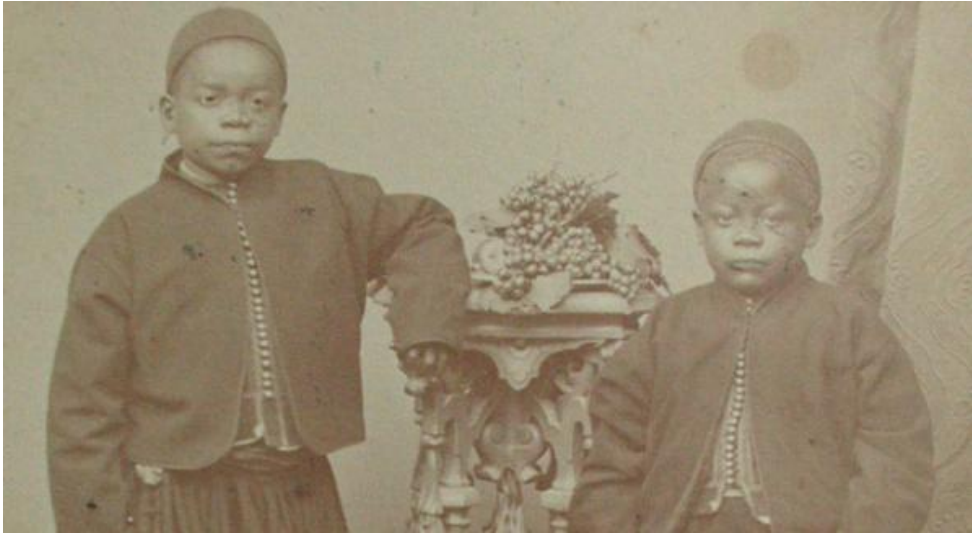
I due pigmei akka portati in Italia dopo la morte di Miani

indumenti, calzature e animali esotici imbalsamati, carte geografiche da lui redatte. Si tratta di una grande raccolta di reperti che lo stesso Miani decide di mostrare a tutti. Lui stesso fa un progetto di come questi oggetti dovevano essere esposti. Sarà proprio lui a fondare a Venezia, il primo museo etnografico d'Europa che oggi si chiama Museo di Storia naturale "Giancarlo Ligabue". Questo conserva ancora tutti gli oggetti recuperati da Miani che seguono il suo personale progetto espositivo.