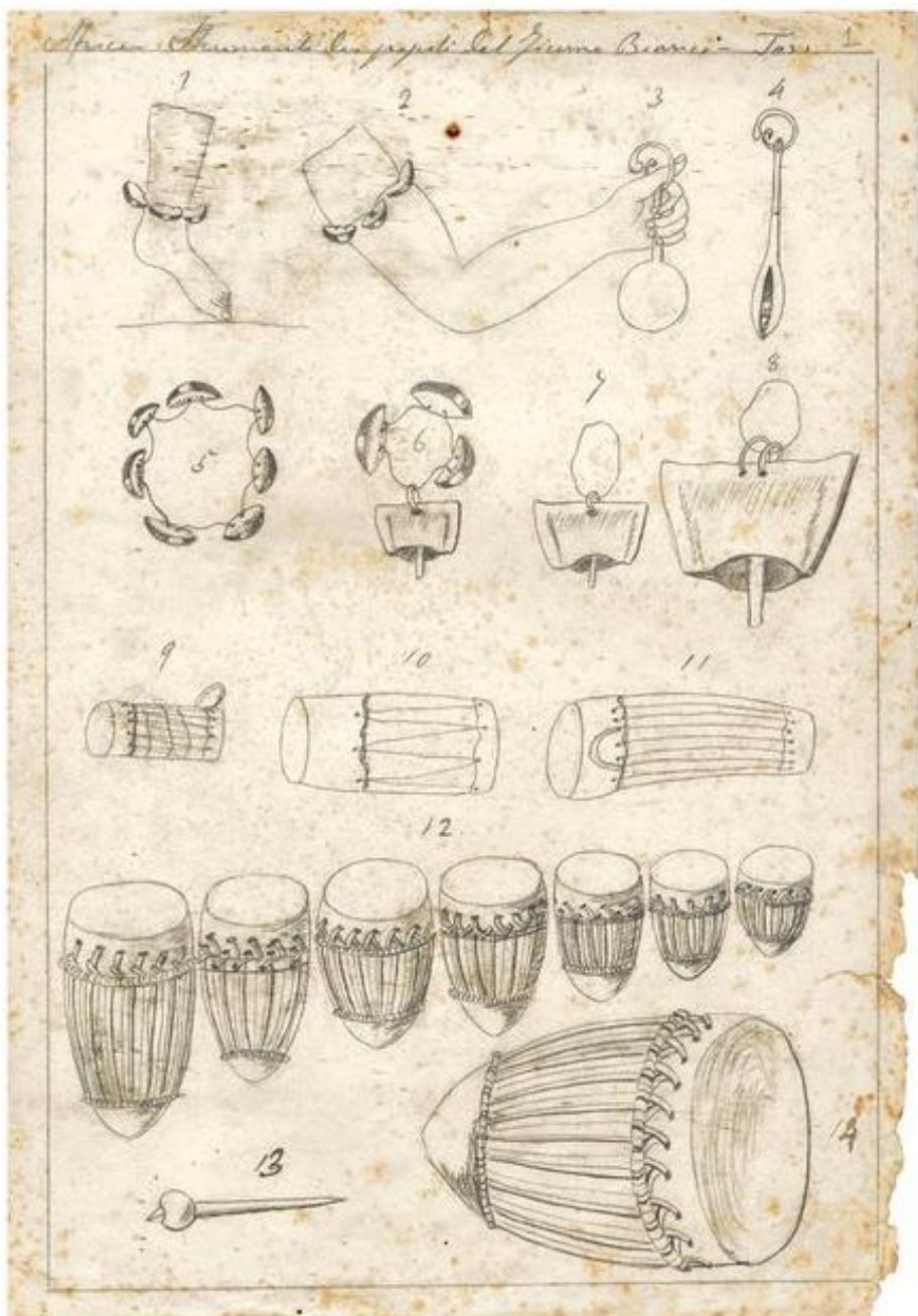
Disegni eseguiti da Miani nei suoi Diari

non furono trovate! Fu tuttavia il primo esploratore europeo che giunse più a sud nella ricerca delle sorgenti del Nilo risalendo il fiume.