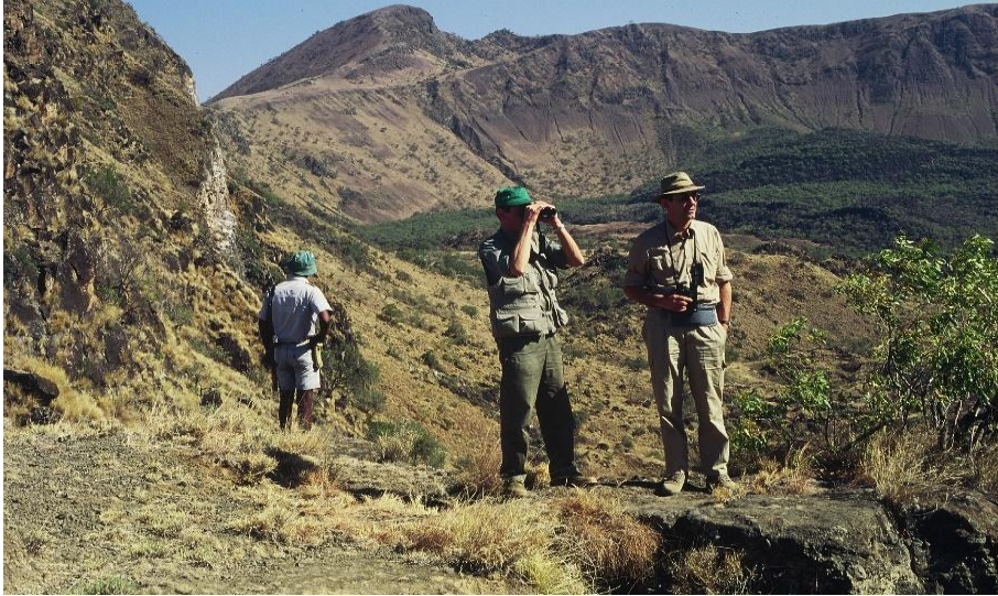
Sul bordo del cratere del vulcano nella Regione degli Afar