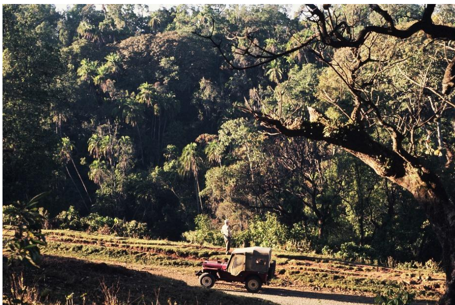
Verso il Parco Nazionale del Bale tra Shashamane e Dodola

Percorremmo strade più o meno asfaltate e piste sconnesse con un vero e proprio residuo bellico: la Jeep Willys. Fu infatti questo l'unico