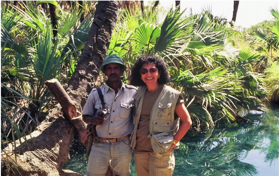
Nella terra degli Afar