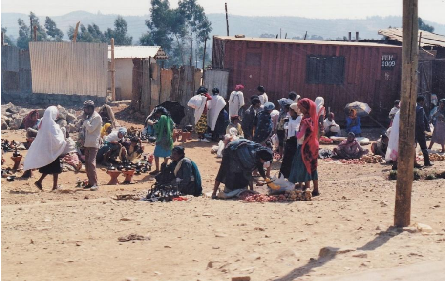
Un povero mercato alla periferia di Addis Abeba

Non me ne voglia mia moglie, ma fu proprio lei protagonista di alcuni episodi... simpatici, quando non imbarazzanti. Come appunto quello accaduto ad Awash. Quando mi ero recato al Parco nazionale di Awash col Prof. Toschi i pochi visitatori venivano sistemati in alcune tende e non vi era alcun servizio di ristoro. I tempi erano cambiati. Le tende erano state sostituite da comode roulotte e il campo era servito da una sorta di bar ove era possibile fare abbondante colazione a prezzo contenuto.