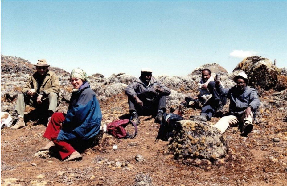
Alcuni protagonisti della battuta si stanno rifocillando

Prima di abbandonare la “mia” Africa voglio raccontare un ultimo episodio.