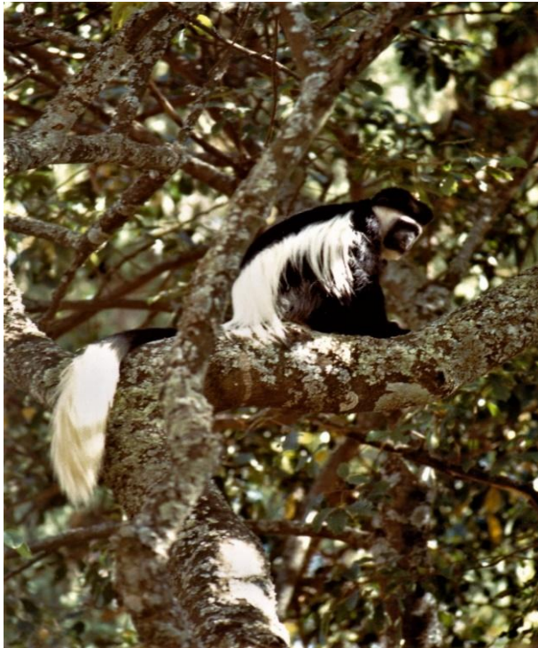
Guereza o Colobo abissino

In altra occasione, mentre attraversavamo una foresta nel Parco nazionale del Bale, mi sussurrò all'orecchio che non si spiegava la ragione di quei sacchetti di plastica bianca che ogni tanto vedeva numerosi sugli alberi. La confortai: la distanza non consentiva di vedere tra il fogliame le scimmie Guereza, ma le parti bianche del loro mantello ne tradivano la presenza. Mi ringraziò per la riservatezza con la quale le avevo risposto.