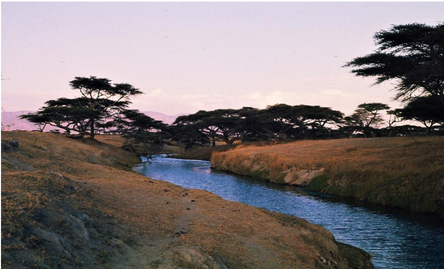
Un'insenatura del lago Abijata

mezzo di trasporto che riuscimmo ad affittare ad un prezzo a noi accessibile. Tutt'altro che mimetica (era stata riverniciata di rosso!) e di aspetto precario, si dimostrò assai affidabile nei percorsi sterrati, ma assai scomoda. Anche la guida richiedeva una esperienza particolare.