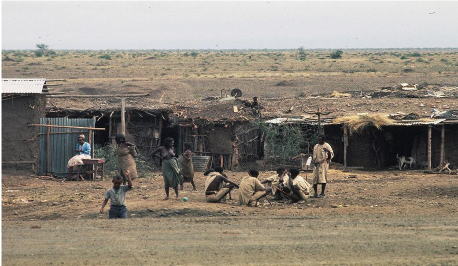
Il villaggio Hafar tra Gewane e Awash

Potrà sembrare poco credibile agli occhi di noi occidentali, ma a quei tempi, in quelle terre lontane da centri abitati, in assenza di stazioni di polizia col compito di sovrintendere il territorio, abitate da predoni e da un popolo bellicoso tutto poteva accadere.