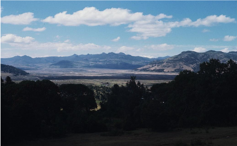
Nel Parco nazionale di Bale