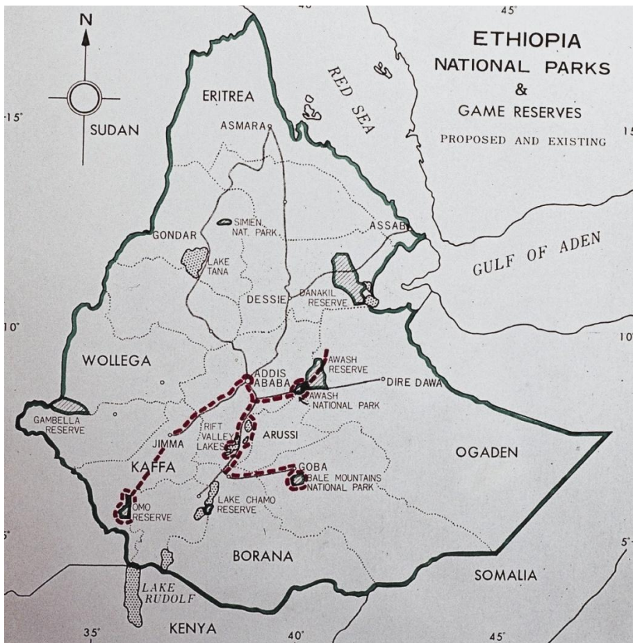
Il tratteggio in colore rosso indica l'itinerario compiuto

dell'Etiopia all'Italia, e da un autista campione di rally che conduceva la propria auto Renault da competizione. Non certo l'automobile che poteva auspicare un novello esploratore!