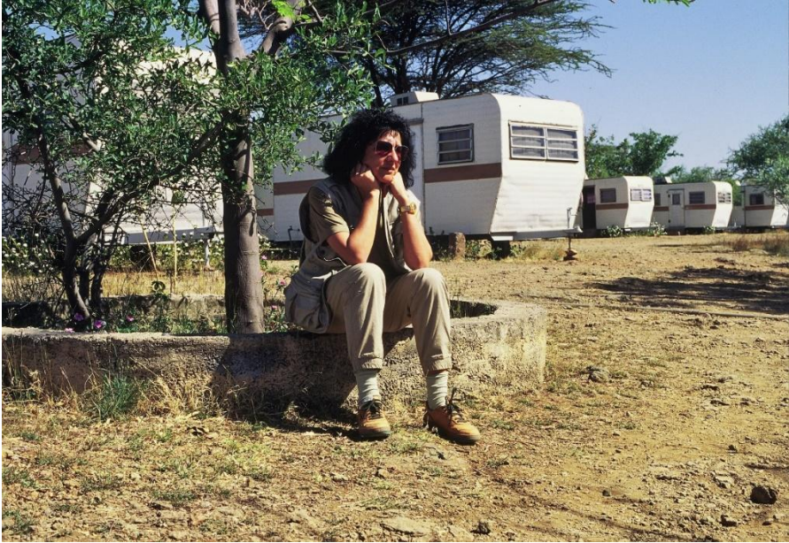
Il campo attrezzato per i turisti nel Parco Nazionale di Awash