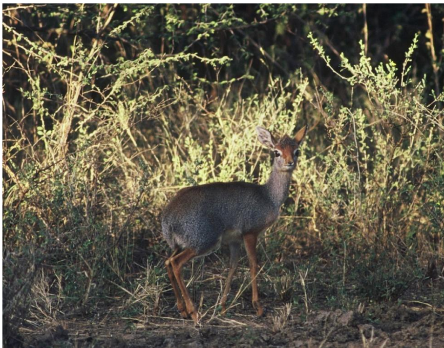
La fugace apparizione di una piccola antilope: il Dik dik

ore centrali della giornata ci costringeva ad una siesta forzata distesi sulle brande. Diversamente dal Prof. Toschi e dall'agente turistico, che si assopivano, io restavo sveglio, annoiato e immobile in un bagno di sudore, in attesa del momento favorevole alla escursione pomeridiana. In uno di quei momenti udii improvvisamente il suono di una musica e gioiose grida giovanili. Provenivano da uno stretto fiume che scorreva a poche centinaia di metri dal campo e, incuriosito da tanto clamore, mi avviai in quella direzione. Solo dopo aver percorso il sentiero nella sua ripida discesa ed avere superato l'ultima curva si rese visibile a poche decine di metri l'ansa del fiume è un gruppo di ragazzini di varie età che si tuffavano, nuotavano e giocavano accompagnati dalla musica di una piccola radio transistor.