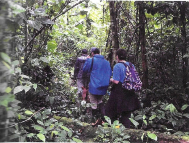
Fig. 6 - In cammino nella Foresta Amazzonica.