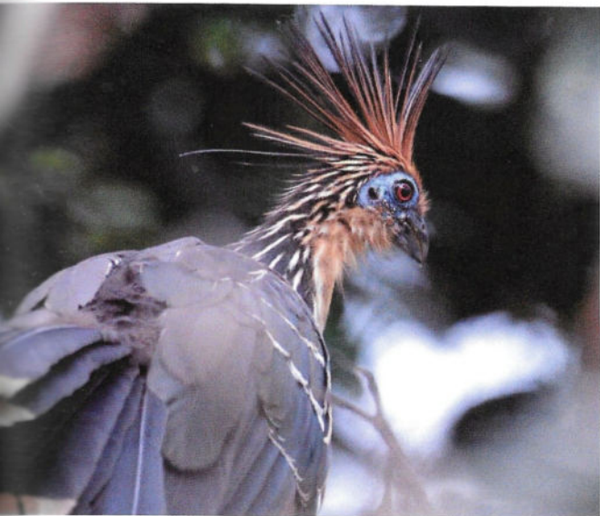
Fig. 3 - Hoatzin ( Opisthocomus hoazin ), l'uccello più puzzolente del mondo.