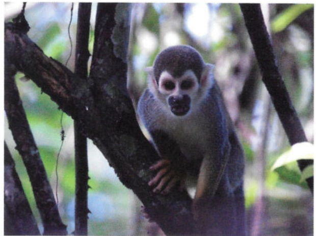
Fig. 1 - Un esemplare di Saimiri di Humboldt ( Saimiri cassiquiarensis macrodon ), uno dei primi animali incontrati nella riserva.

rei, nessuna strada o cantiere. Solo la natura che canta: lo stridere delle cicale e dei grilli, il fruscio del vento tra le palme, i versi e i richiami degli uccelli amazzonici. Si percepisce di essere immersi in un mondo completamente diverso da quello a cui siamo abituati in Italia. Qui tutto è più grande, più verde, più vivo. Dopo qualche minuto di osservazione (sia no-