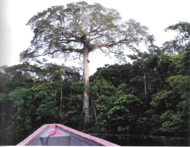
Fig. 9 - Il Ceibo ( Ceiba pentandra ), il più grande albero della Foresta Amazzonica.

tina di minuti, arriviamo alla barca. Mentre sfrecciamo a tutta velocità sull'acqua, il vento fresco ci asciuga il sudore della camminata. Nel cielo riusciamo a osservare una delle specie di avvoltoio più belle: un Avvoltoio reale ( Sarcorampus papa ) che risale con una termica e scompare dopo un po' tra le nuvole. Si tratta dell'avvoltoio più colorato dell'intera