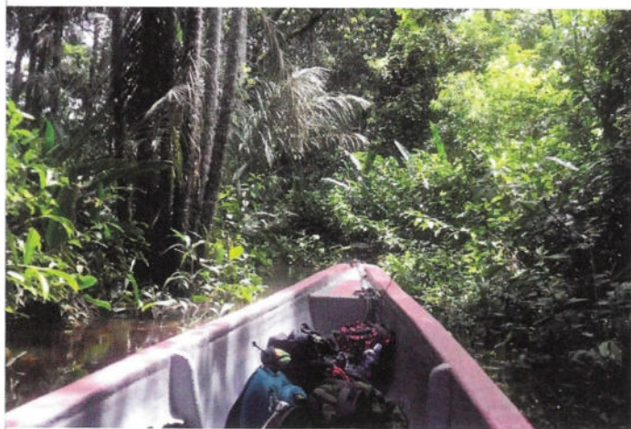
Fig. 2 - Navigare nelle acque del Cuyabeno è spesso difficile. L'acqua è piena di residui di piante e tronchi, dove è facilissimo incastrare l'elica del motore e danneggiarla.

I pecari sono suini sudamericani, simili al nostro cinghiale. Sono ambiti dai locali per la loro carne, ma sono anche prede difficili, in quanto molto schivi e, se minacciati, molto aggressivi. La navigazione continua, e iniziamo a incontrare le prime abitazioni. Sulla riva del fiume, anche a grandi distanze le une dalle altre, si trovano piccole comunità o gruppetti di case isolate. Si tratta di strutture in legno sopraelevate, simili a palafitte ma sulla terraferma, in modo da limitare l'entrata di insetti e altri animali. Le pareti sono poche, e gran parte dello spazio abitativo è aperto verso l'esterno. I tetti, tradizionalmente realizzati intrecciando foglie di palma, sono oggi spesso realizzati in lamiera. All'interno della riserva la gente si sposta prevalentemente in barca e non è raro incrociare altre canoe molte delle quali, come la nostra, trasportano turisti. Negli ultimi anni infatti il turismo è diventato una risorsa economica importante per le popolazioni locali, oltre ad aver contribuito alla protezione e all'espansione dei confini della riserva. Potendo accedere al Cuyabeno solamente via fiume e sempre accompagnati da guide locali, l'affluenza di turisti è mantenuta sotto controllo, e riguarda soprattutto la porzione occidentale della riserva, che si raggiunge in tempi ragionevoli dai centri urbani più vicini.