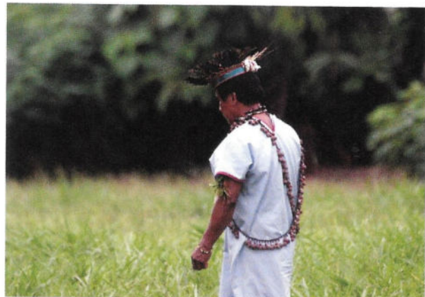
Fig. 5 - Il taita, ovvero lo sciamano dei Siona.

Le piante svolgono anche un ruolo centrale nella medicina tradizionale e nella spiritualità. Numerosissime sono le specie medicinali che le persone ottengono dalla foresta, e la figura che meglio conosce le piante, le loro proprietà curative e i metodi di preparazione è lo sciamano, o taita. Il compito dello sciamano (Fig. 5), come ci spiega egli stesso mentre siamo ospiti nella sua capanna, è quello di curare, proteggere e guidare le persone della comunità. Non solo, il suo ruolo è anche quello di fare da intermediario tra la comunità, il mondo degli spiriti e la natura. Ci parla dell' ayahua-sca , una pianta sacra estremamente rilevante