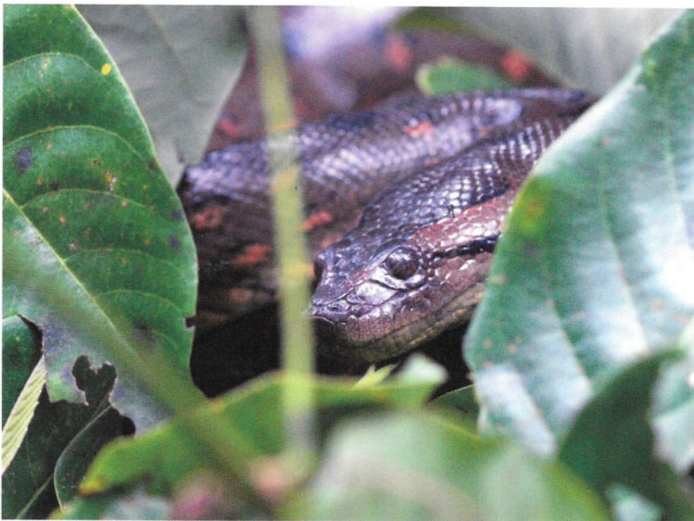
Fig. 10 - L'Anaconda verde ( Eunectes murinus ) nascosta nella vegetazione.

Nel pomeriggio arriva la fine della nostra permanenza nel Cuyabeno. Ma anche sulla strada del ritorno, mentre la barca ci riporta fuori dalla riserva, la foresta ci offre un ultimo eccezionale incontro. Tra i cespugli sulla riva riposa acciambellata una bellissima Anaconda verde ( Eunectes murinus ) di almeno due metri, perfettamente mimetizzata e inizialmente