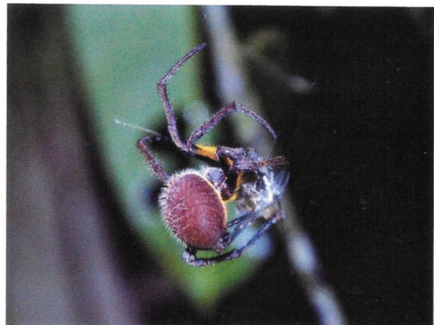
Fig. 7 - La femmina di Eriophora fuliginea che avvolge la preda.

Appena entriamo tra gli alberi incontriamo una grandissima ragnatela con al centro un ragno grosso come una noce. Si tratta di una femmina di Eriophora fuliginea , appostata in attesa di una preda (Fig. 7). La luce dei frontalini rivela tutta la sua bellezza: le setole sul suo addome, grosso come una moneta da venti centesimi, riflettono una luce dorata. La sua attesa viene ricompensata da una vespa che, attirata dalle nostre luci, si fionda a tutta velocità nella tela. Nel giro di qualche secondo il ragno la avvolge nella seta, finché non ne rimane solo un piccolo bozzolo bianco. La selva di notte cambia completamente. Ovunque attorno a noi è tutto uno zampettio di artropodi: dai più grandi, come le tarantole o gli insetti stecco, ai più piccoli, come le cavallette e le formiche. Non mancano poi i predatori, ora attivi come non mai. Osserviamo un gecko ( Thecadactylus solimoensis ) mimetizzato su un tronco, in attesa che una preda gli passi davanti, e un sottilissimo serpente arboreo che, disturbato dalle nostre luci, si arrampica rapido su un ramo. Arrivati a un certo punto abbandoniamo il sentiero principale e iniziamo a scendere, seguendo una traccia appena visibile. Su una foglia, a circa tre metri di altezza, notiamo un grosso ragno, che Fercho identifica come un Ragno delle banane ( Phoneutria fera ). Dal basso non si riescono ad apprezzare a pieno le sue dimensioni, ma è a dir poco enorme e ciò ci fa pensare che si tratti di una femmina. Questa specie caccia